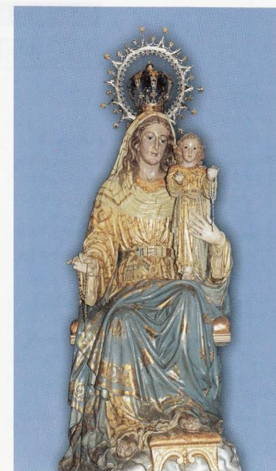
NUESTRA SEÑORA DEL ROSARIO Iglesia de San Pablo, Valladolid